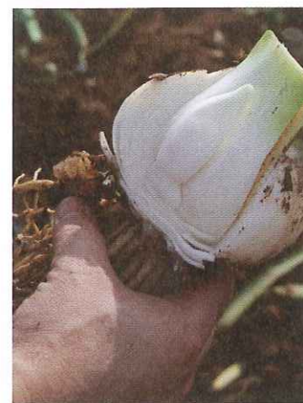
Löken är öppnad med ett exakt snitt. Då ses blomstängelanlagen. När det nästlängsta är cirka 2,5 cm det dags att skörda löken.

I slutet av september kommer lökarna till Norden. De första bör-