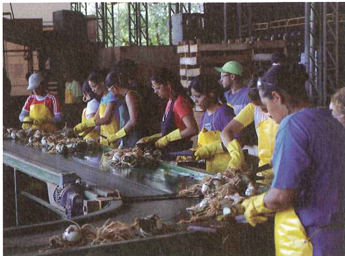
Manuell hantering vid löpande band direkt efter skörd, med tvättning och putsning.

Terra Viva grundades 1959. Från 1987 gick man in för ama-