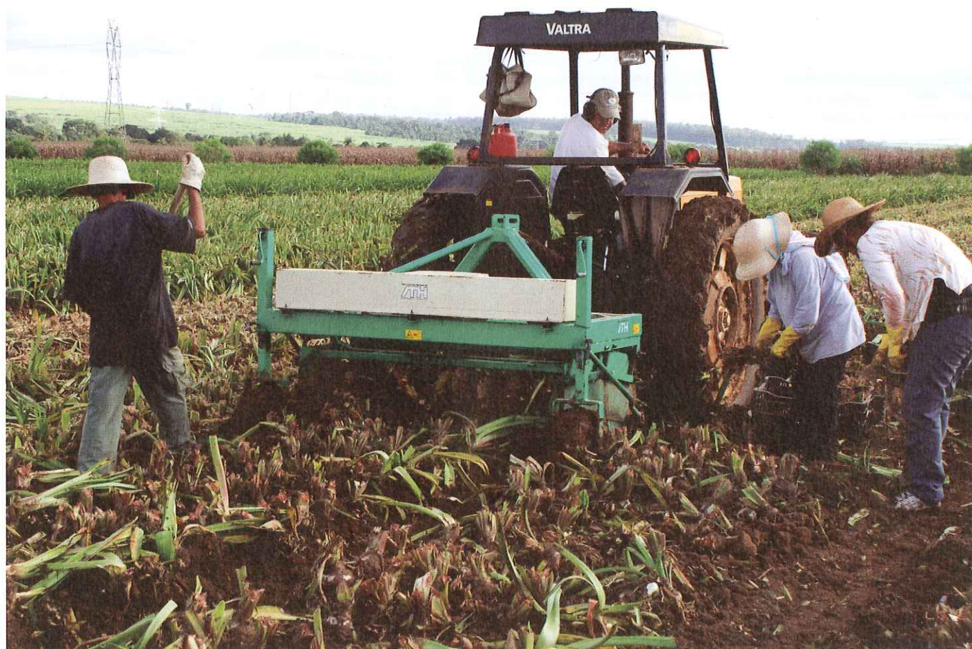
Amaryllislökar skördas på den bördiga marken vid Holambra i Brasilien. Julens amaryllis skördas i april och förutom en traktor är 50 arbetare ute på fältet. Först lyfts löken varefter rötterna skärs kortas av.

I och för sig kan man börja odla Hippeastrum när som helst